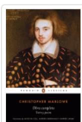
OBRA COMPLETA. TEATRO Y POESIA (MARLOWE) MARLOWE, CHRISTOPHER