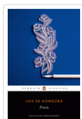
POESIA (GONGORA) GONGORA, LUIS DE