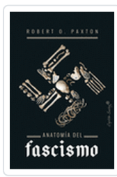
ANATOMIA DEL FASCISMO O, PAXTON, ROBERTO