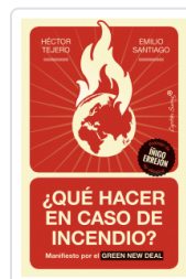
QUE HACER EN CASO DE INCENDIO ? SANTIAGO MUIÑO, EMILIO / TEJERO FRANCO,