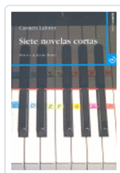
SIETE NOVELAS CORTAS LAFORET DIAZ, CARMEN