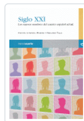
SIGLO XXI VV.AA.