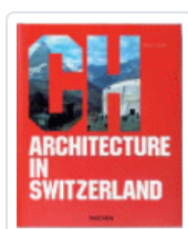
ARCHITECTURE IN SWITZERLAND (ING) JODIDIO, PHILIP