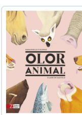
OLOR ANIMAL FIGUERAS, EMMANUELLE / DE GASTOLD, CLAIR