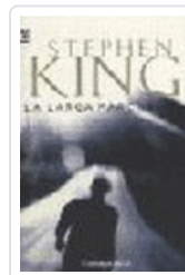
LARGA MARCHA, LA 102/19 KING, STEPHEN