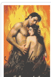
LLAMA Y LA FLOR, LA CISNE 45/1 WOODIWISS