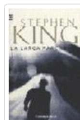
LARGA MARCHA, LA 102/19 KING, STEPHEN