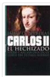
CARLOS II EL HECHIZADO CONTRERAS, JAIME