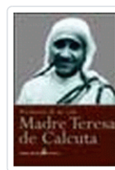
MADRE TERESA: MI VIDA POR LOS POBRES