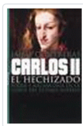
CARLOS II EL HECHIZADO CONTRERAS, JAIME