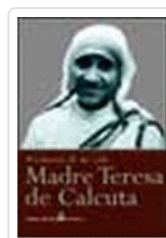
MADRE TERESA:MI VIDA POR LOS POBRES