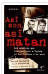
ASI SON, ASI MATAN MARLASCA/RENDUELES