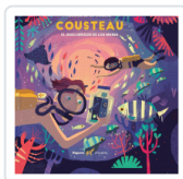
COUSTEAU ZWICK EBY, PHILIPPE