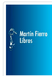
GOLIAT. EN EL MUNDO DE LAS DIFERENCIAS ABADIA, XIMO