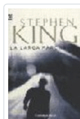
LARGA MARCHA, LA 102/19 KING, STEPHEN