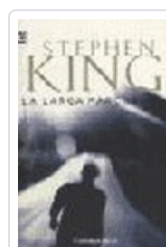
LARGA MARCHA, LA 102/19 KING, STEPHEN