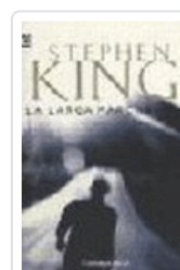
LARGA MARCHA, LA 102/19 KING, STEPHEN