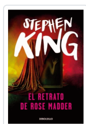
RETRATO DE ROSE MADDER, EL