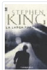
LARGA MARCHA, LA 102/19 KING, STEPHEN