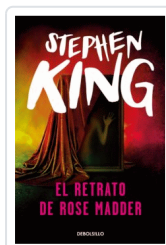
RETRATO DE ROSE MADDER, EL