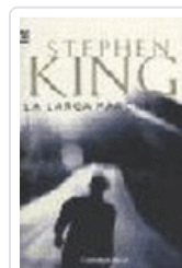
LARGA MARCHA, LA 102/19 KING, STEPHEN