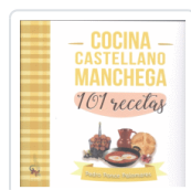
COCINA CASTELLANO MANCHEGA 101 RECETAS PON, PEDRO