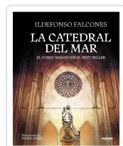
CATEDRAL DEL MAR, LA (COMIC) FALCONES, ILDEFONSO