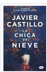
CHICA DE NIEVE, LA CASTILLO, JAVIER