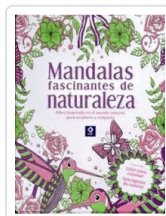
MANDALAS FASCINANTES DE LA NATURALEZA (CAJA METALICA) IGLOO BOOKS LTD