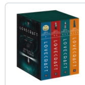
PACK H.P. LOVECRAFT. OBRA COMPLETA LOVECRAFT, H.P.