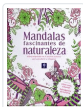
MANDALAS FASCINANTES DE LA NATURALEZA (CAJA METALICA) IGLOO BOOKS LTD