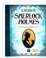
MUNDO DE SHERLOCK HOLMES: GUIA ELEMENTAL, EL SMITH, DANIEL