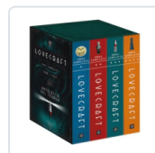
PACK H.P. LOVECRAFT. OBRA COMPLETA LOVECRAFT, H.P.