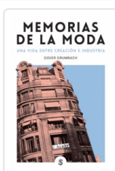
MEMORIAS DE LA MODA GRUMBACH, DIDIER