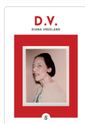
D.V. VREELAND, DIANA