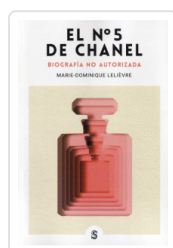
Nº 5 DE CHANEL LELIEVRE, MARIE-DOMINIQUE