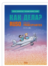
RUSO PARA PRINCIPIANTES A2 LEONTIEVA, OLGA/NORKO KORB, OKSANA