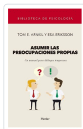
ASUMIR LAS PREOCUPACIONES PROPIAS ARNKIL, TOM ERIK/ERIKSSON, ESA