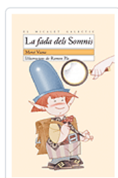
FADA DELS SOMNIS (MG.91) VIANA, MERCE