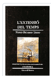
EXTENSIO DEL TEMPS (E.43) RICARDO, X.