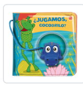
JUGAMOS COCODRILO CLIMA GABRIELE