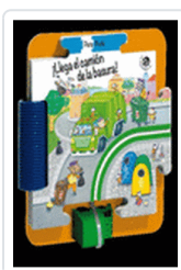
LLEGA EL CAMION DE LA BASURA MANTEGAZZA GIOVANNA