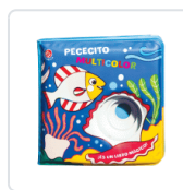
PECECITO MULTICOLOR CLIMA GABRIELE