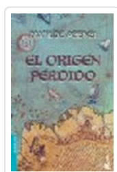
ORIGEN PERDIDO (NF) MATILDE ASENSI