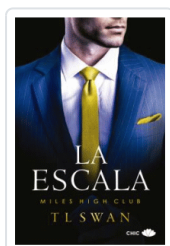
ESCALA, LA SWAN, T L