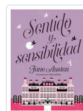
SENTIDO Y SENSIBILIDAD AUSTEN, JANE