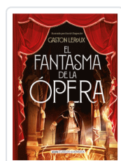
FANTASMA DE LA OPERA, EL LEROUX, GASTON