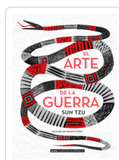
ARTE DE LA GUERRA, EL SUN-TZU