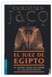
JUEZ DE EGIPTO, EL JACQ, CHRISTIAN