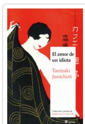
AMOR DE UN IDIOTA TANIZAKI, JUNICHIRO