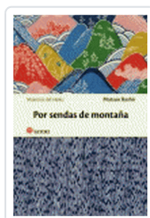
POR SENDAS DE MONTAÑA MATSUO, BASHO