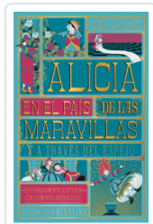
ALICIA EN EL PAIS DE LAS MARAVILLAS CARROLL, LEWIS