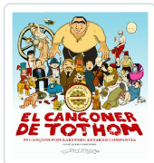
CANCONER DE TOTHOM, EL - 99 CANÇONS POPULARS PER CANTAR PUIG, ALBERT