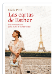
CARTAS DE ESTHER, LAS PIVOT, CÉCILE