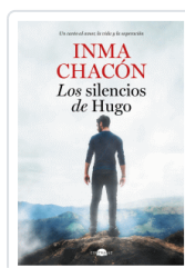
SILENCIOS DE HUGO, LOS CHACÓN, INMA