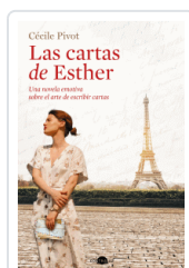
CARTAS DE ESTHER, LAS PIVROT, CECILE