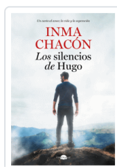
SILENCIOS DE HUGO, LOS CHACON, INMA