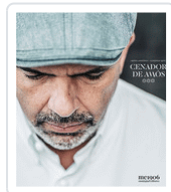
CENADOR DE AMOS SANCHEZ, JESUS