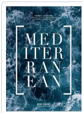
MEDITERRANEAN GENESTRA, ANDREU