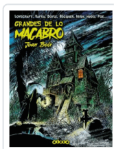
GRANDES DE LO MACABRO BOIX, JOAN