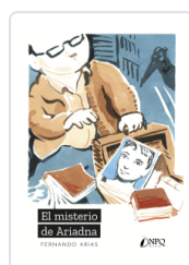
MISTERIO DE ARIADNA, EL ARIAS, FERNANDO