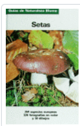
SETAS GNB GRUNERT