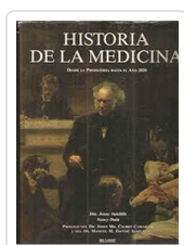
HISTORIA DE LA MEDICINA SUTCLIFFE/DUIN