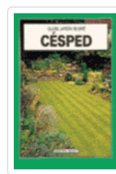
CESPED GJB BECKETT