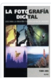
FOTOGRAFIA DIGITAL, LA ANG, TOM