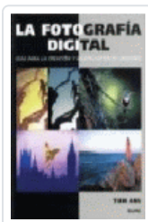
FOTOGRAFIA DIGITAL, LA ANG, TOM