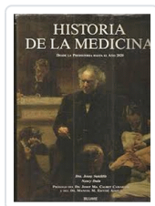
HISTORIA DE LA MEDICINA SUTCLIFFE/DUIN