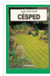
CESPED GJB BECKETT