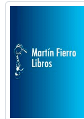
SETAS GNB RUSTICA GRUNER