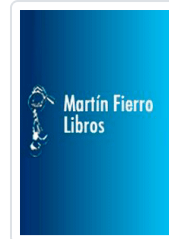
SETAS GNB RUSTICA GRUNER