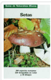
SETAS GNB GRUNERT