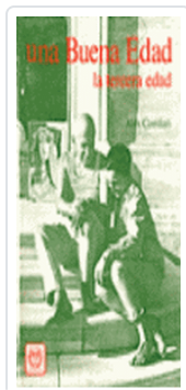
BUENA EDAD, UNA COMFORT