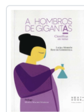
A HOMBROS DE GIGANTAS. CIENTIFICAS EN VERSO MORRON, LAURA