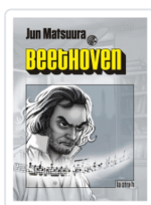
BEETHOVEN MATSUURA, JUN.