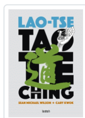
TAO TE KING ILUSTRADO LAO-TSE