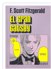
GRAN GATSBY, EL FITZGERALD, FRANCIS SCOTT