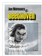
BEETHOVEN MATSUURA, JUN.