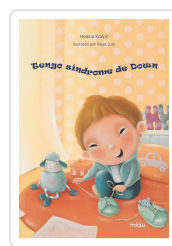
TENGO SÍNDROME DE DOWN Kraljic, Helena ; Kraljic, Helena