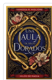
JAULA DE HILOS DORADOS, UNA MIGLIORE, VANESSA R.