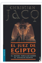
JUEZ DE EGIPTO, EL JACQ, CHRISTIAN