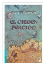
ORIGEN PERDIDO (NF) MATILDE ASENSI