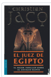
JUEZ DE EGIPTO, EL EL JACQ, CHRISTIAN