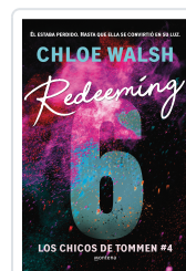
REDEEMING 6 (CHICOS DE TOMMEN 4) Walsh, Chloe