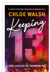
Keeping 13 (Los chicos de Tommen 2) Walsh, Chloe