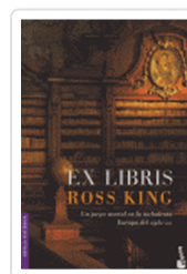
EX LIBRIS ROSS KING