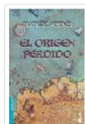
ORIGEN PERDIDO (NF) MATILDE ASENSI